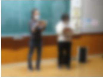
もも・まゆワンダー