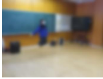
キラキラなわとび