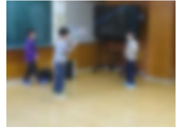
なわとびブラザーズ