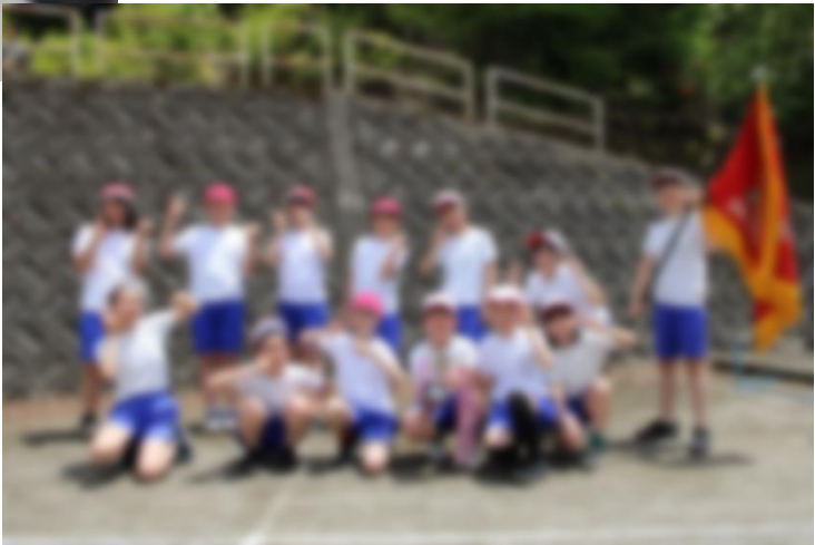
全校をリードした運動会！