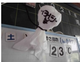
職員室に現れた 「てるてる坊主」 ～教頭作～