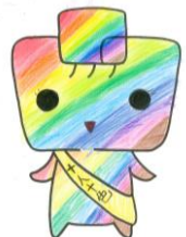
思いやりのキャラクター にじみん

石川小学校が、子どもたちの「できた!」「わかった!」「うれしい!」「楽しい!」が光いっぱいの学校になるよう、引き続き、教職員一同で力を合わせて取り組んでいきます。