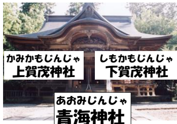
かみかもじんじや 上賀茂神社