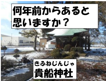
きふねじんじや 貴船神社