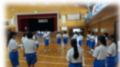
結団式後の軍集会の様子