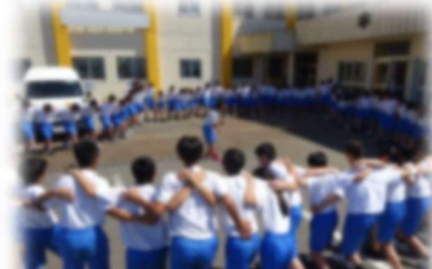
結団式後の軍集会の様子