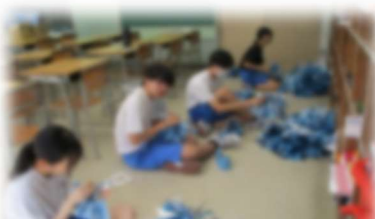
夏休み中の活動（道具）