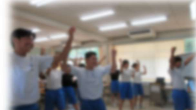
夏休み中の活動（応援）