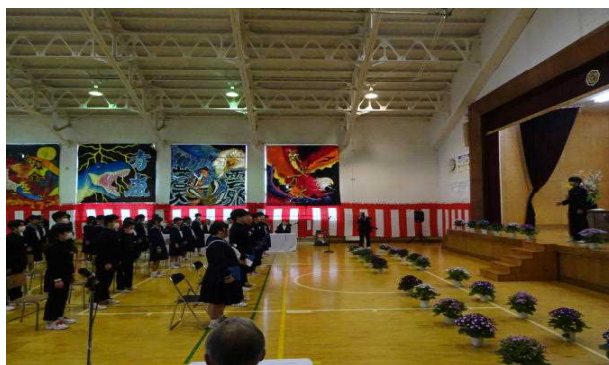
全校で最後の校歌を歌っている様子