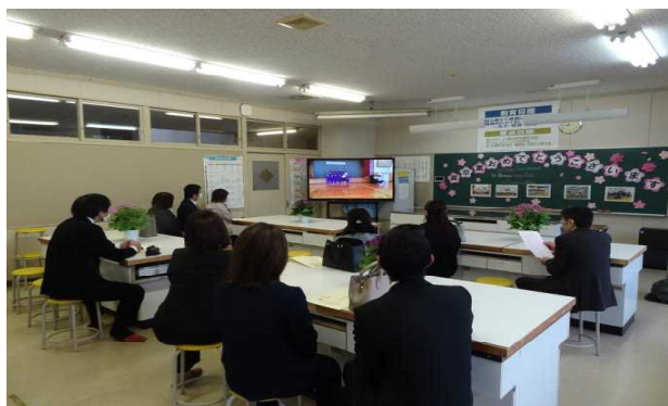
卒業式前の保護者控え室の様子