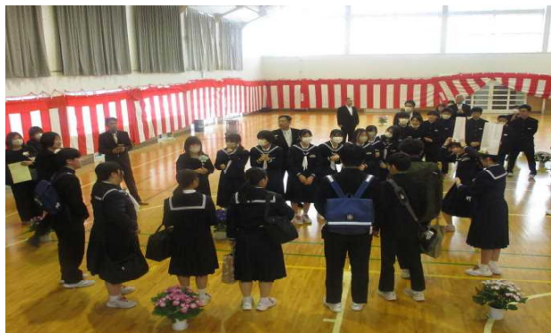
卒業生のお見送り