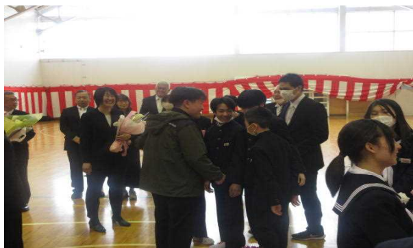
卒業生のお見送り