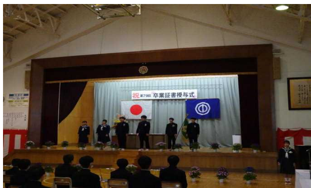
式後の卒業生から歌のプレゼント