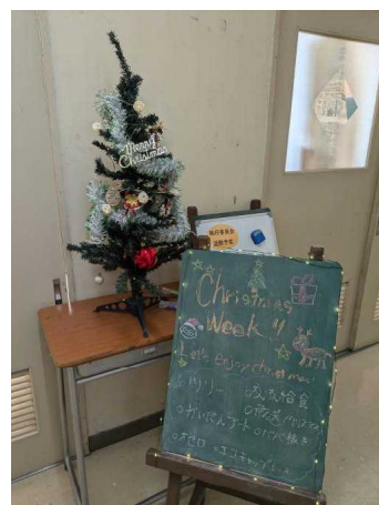
生徒会室前クリスマスツリーの様子