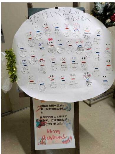
保育園児へのメッセージ