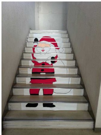
階段アートの様子