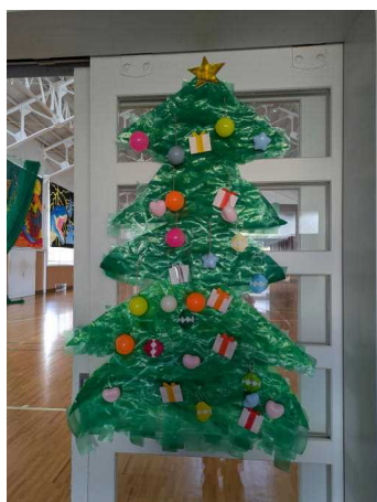
クリスマスツリーの様子