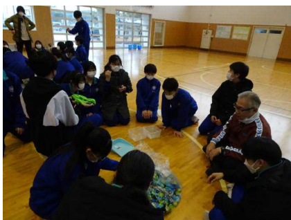
キャップ分別レースの様子