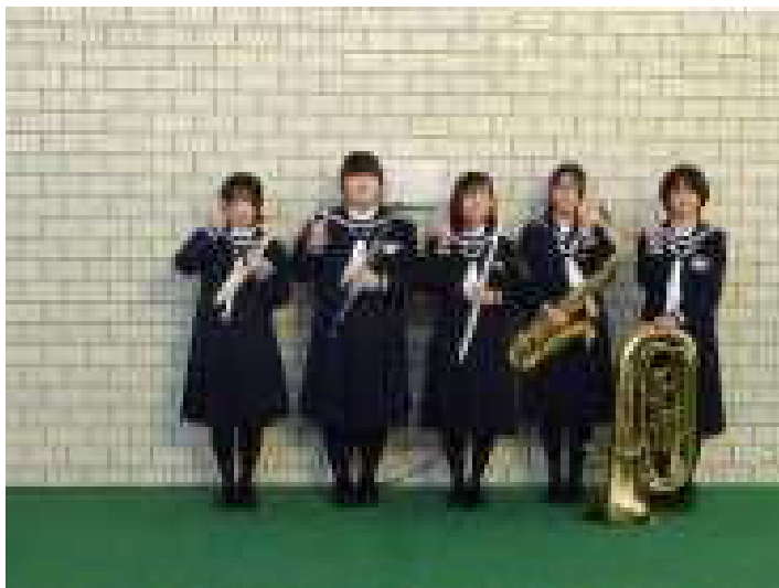
やりきった吹奏楽部のメンバーの笑顔溢れる様子

第30回西関東アンサンブルコンテスト予選、第48回新潟県アンサンブルコンテストが12月7日（土）に長岡市立劇場で開催され、吹奏楽部の5名が出場しました。演奏曲は、「ミスティック・パレット I II」管音打楽器5重奏で、結果は銀賞でした。大変おめでとうございます。寒い日が続き、体調不良となった人もいましたが、一人一人ができることを精一杯やり遂げた結果だと思います。お疲れ様でした。素晴らしい演奏を聴かせていただきました。審査員の皆様からは、とても高い評価をいただきました。